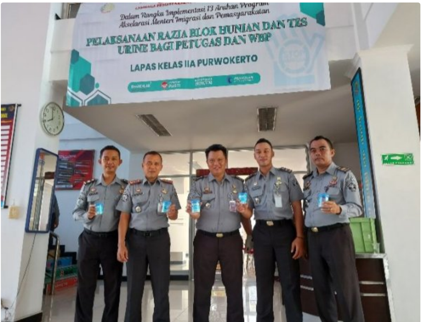
Komitmen Berantas Peredaran Narkoba, Lapas Purwokerto Adakan Tes Urine bagi Petugas dan WBP

PURWOKERTO - Lembaga Pemasarakatan (Lapas) Kelas IIA Purwokerto mengadakan pemeriksaan tes urine bagi seluruh Petugas dan sampling WBP sebagai bentuk komitmen dalam memberantas peredaran Narkoba. Pelaksanaan kegiatan bertempat di Lobby Lt.1 Gedung Utama Lapas Purwokerto, pada