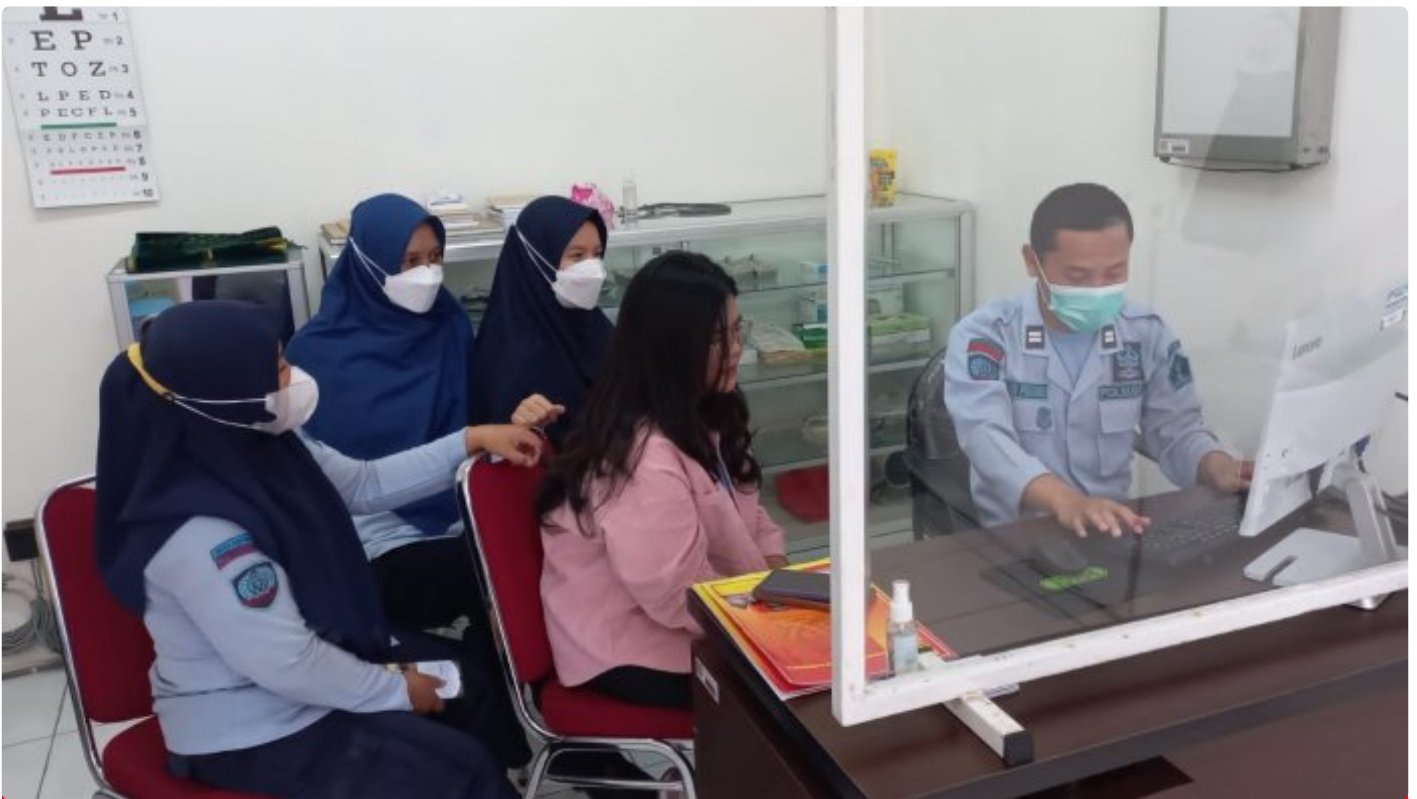
Klinik Pratama Rawat Jalan Lapas Purwokerto Terapkan Rekam Medis Elektronik dengan Aplikasi Klinik Pintar

PURWOKERTO – Klinik Pratama Rawat Jalan Lembaga Pemasyarakatan Kelas IIA Purwokerto telah memperoleh Surat Ijin Operasional Klinik sejak 28 Maret 2023, dan telah terdaftar sebagai Fasilitas Pelayanan Kesehatan di Kementerian Kesehatan Republik Indonesia dengan kode Fasyankes: 1239299.